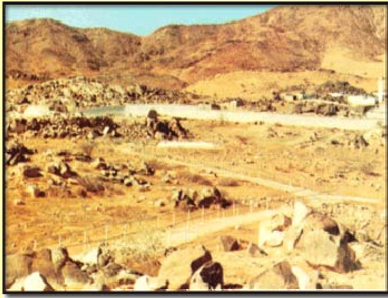
لهو شوینهی جهنگی بهندی گهردی تپندا کرا